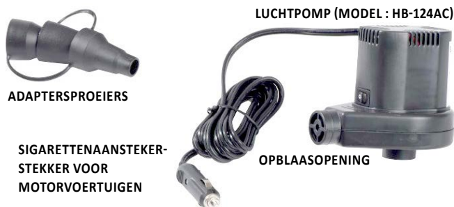
LUCHTPOMP (MODEL : HB-124AC)